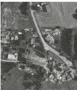
POZEMEK PARC. Č. 47/1