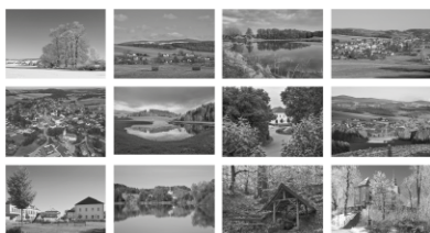
Dolní Čermná | 2023