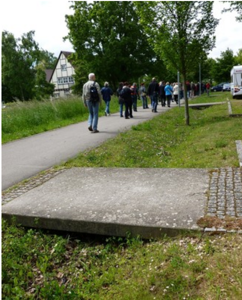
zasakovací průleh u místní komunikace (Mnichov)