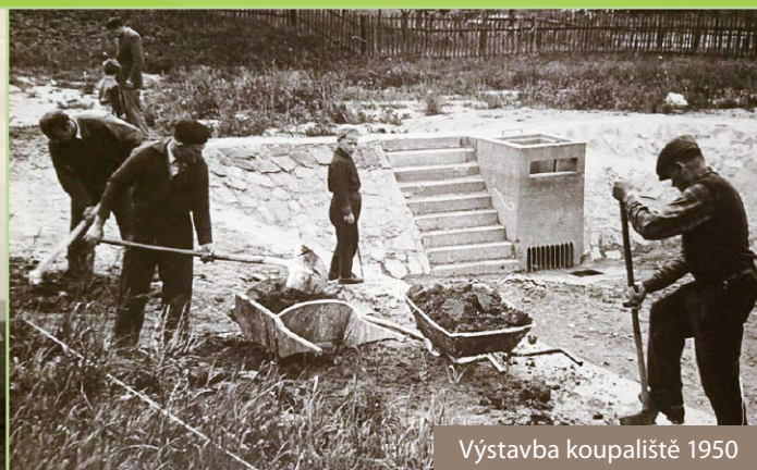
Výstavba koupaliště 1950