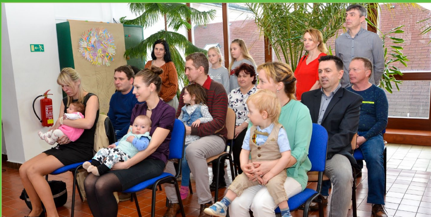
Besídka ke Dni matek: Sluníčka a kytičky zpívaly si písničky