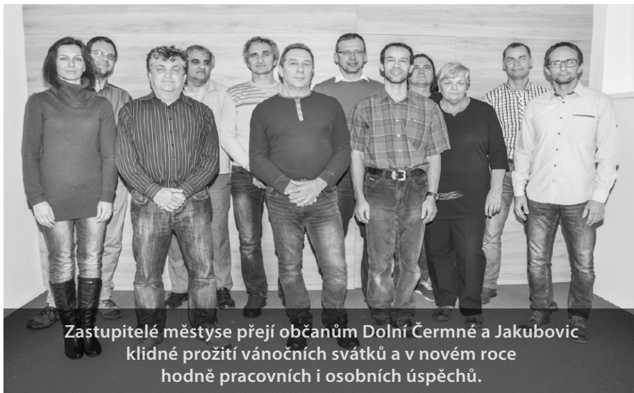
Zastupitelé městyse přejí občanům Dolní Čermná a Jakubovic klidné prožití vánočních svátků a v novém roce hodně pracovních i osobních úspěchů.

Zastupitelé také byli informováni o schválení rozpočtové změny č. 2 k rozpočtu městyse na rok 2017 a o důvodech jejího přijetí.