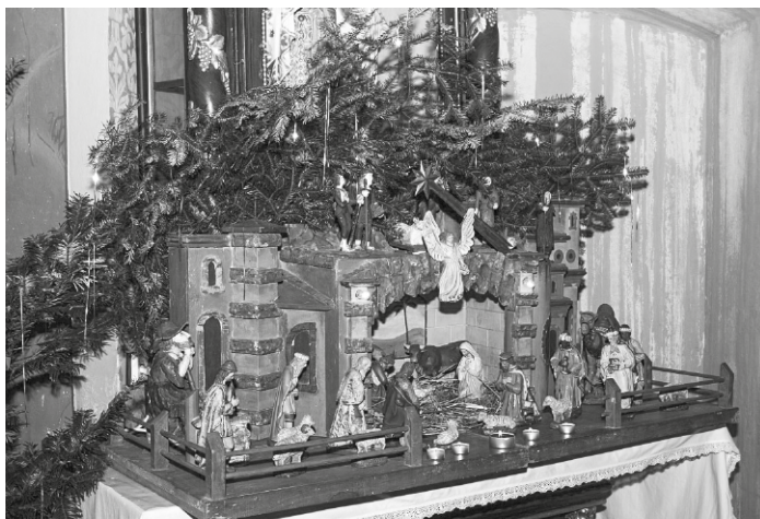
Betlém v jakubovickém kostele