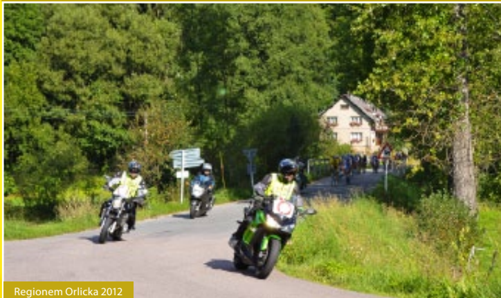
Regionem Orlicka 2012