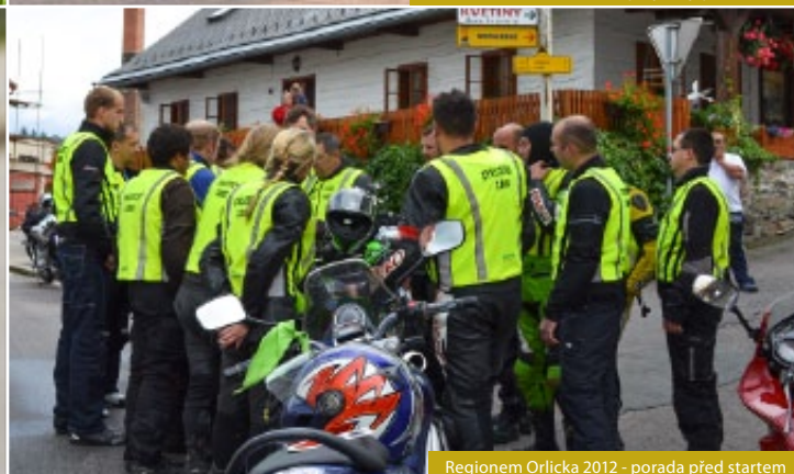
Regionem Orlicka 2012 - porada před startem