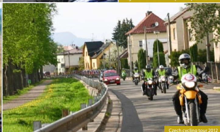
Czech cycling tour 2012