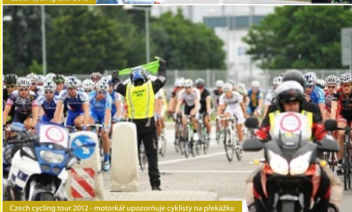
Czech cycling tour 2012 - motorkář upozorňuje cyklisty na překážku