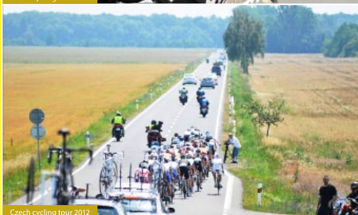
Czech cycling tour 2012