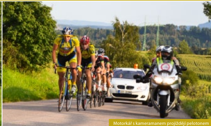
Motorkář s kameramanem projíždějí pelotonem