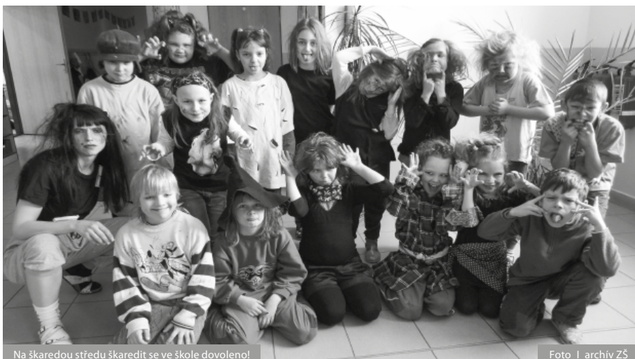
Na škaredou středu škaredit se ve škole dovoleno!