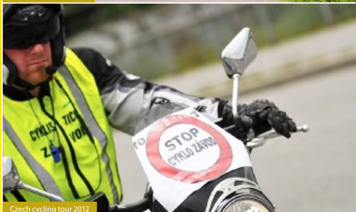
Czech cycling tour 2012