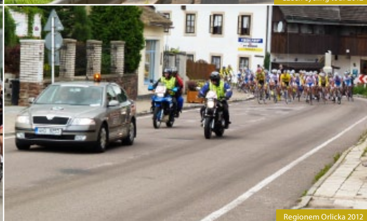
Regionem Orlicka 2012