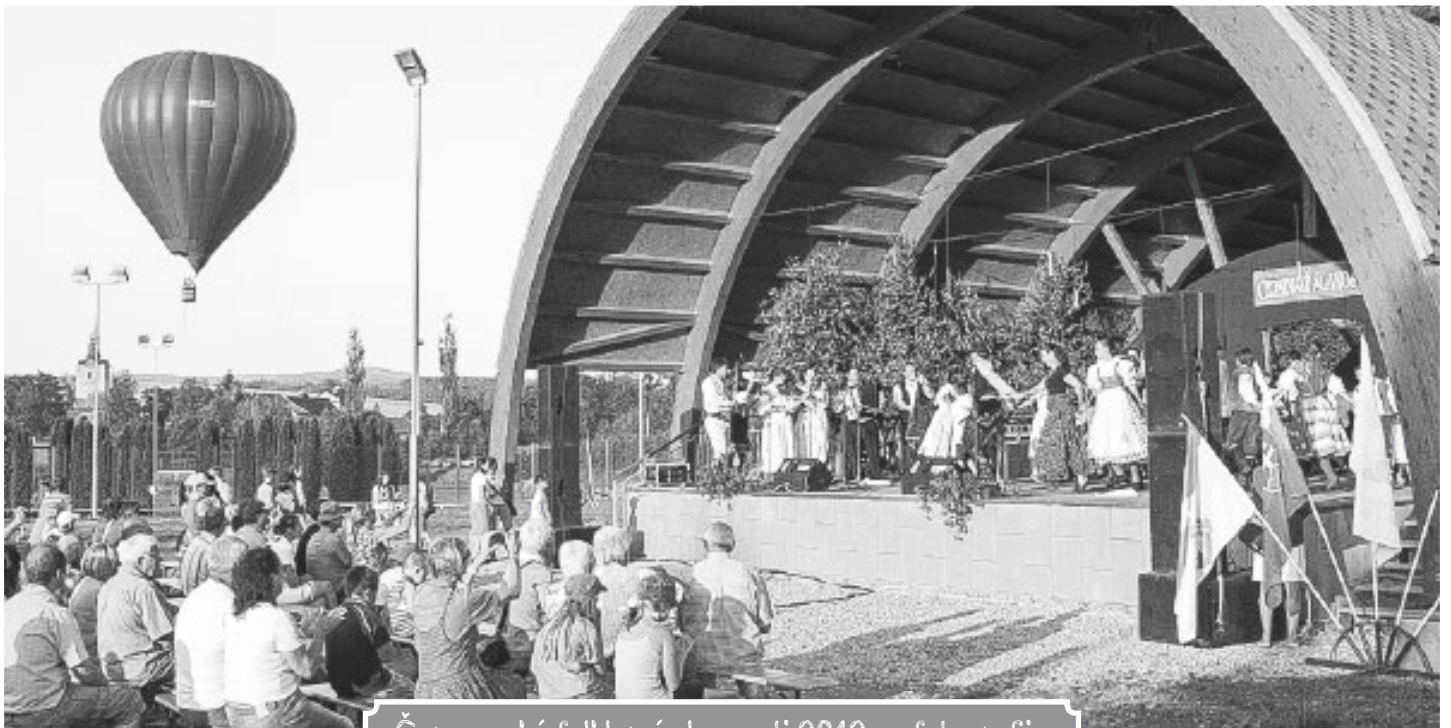
Čermenské folklorní slavnosti 2012 ve fotografii