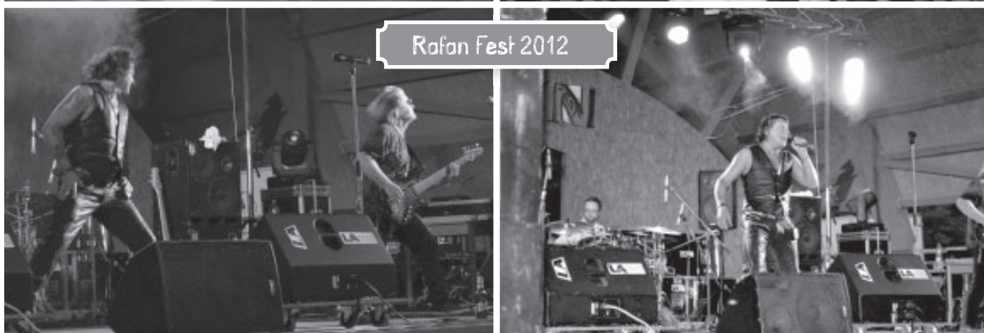
Rafan Fest 2012