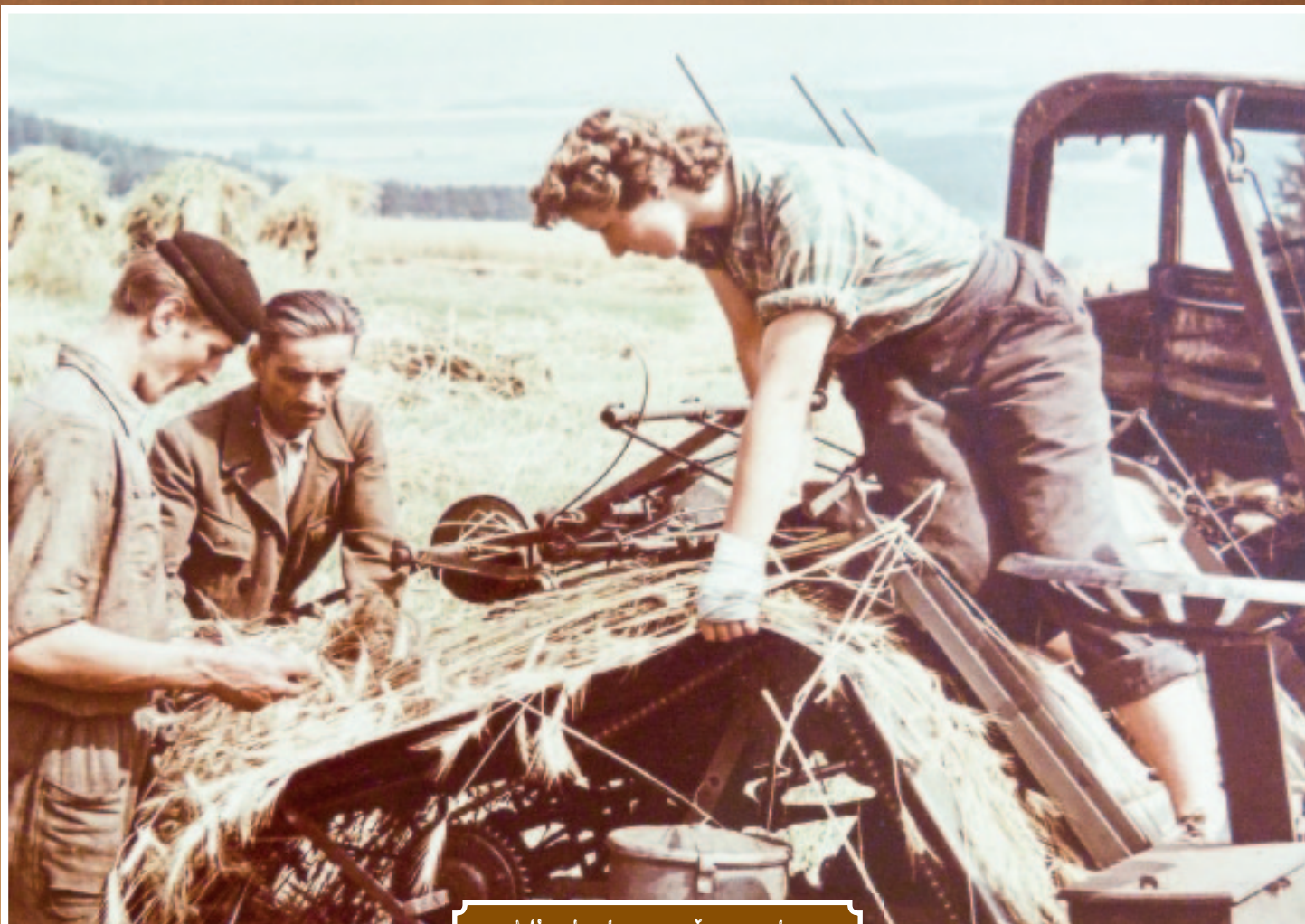
Minulost a současnost