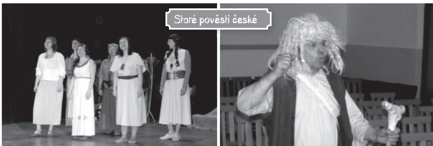
Staré pověsti české